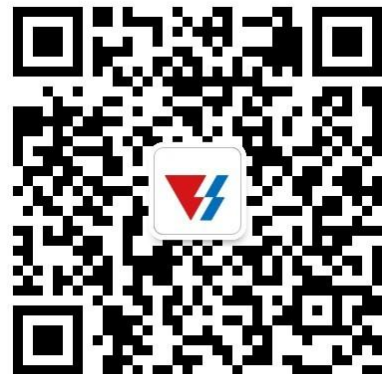
天能校园招聘“微信公众号”